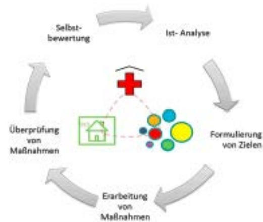
Arbeit in einem Qualitätszirkel

Gesundheitseinrichtungen, die die Qualitätskriterien für Selbsthilfefreundlich-